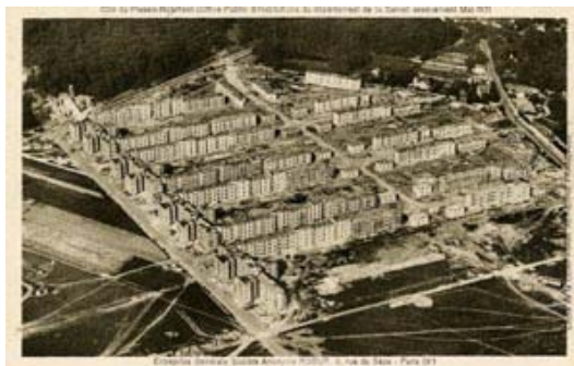
1930: LE PLESSIS ROBINSON, PARIS, ILE-DE-FRANCE