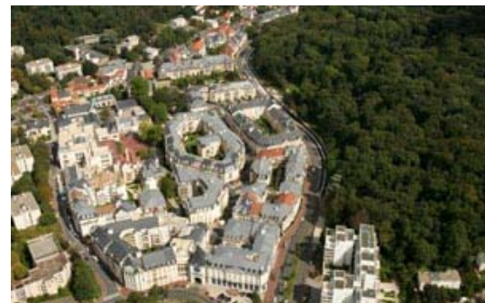
2010: LE PLESSIS ROBINSON, PARIS, ILE-DE-FRANCE